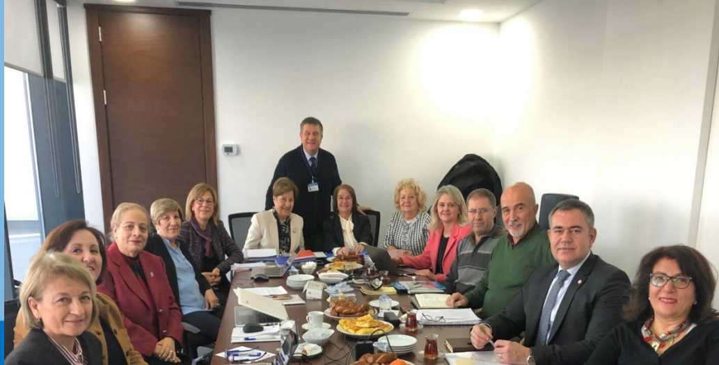
ECZAK toplantısı, 2019 Ankara